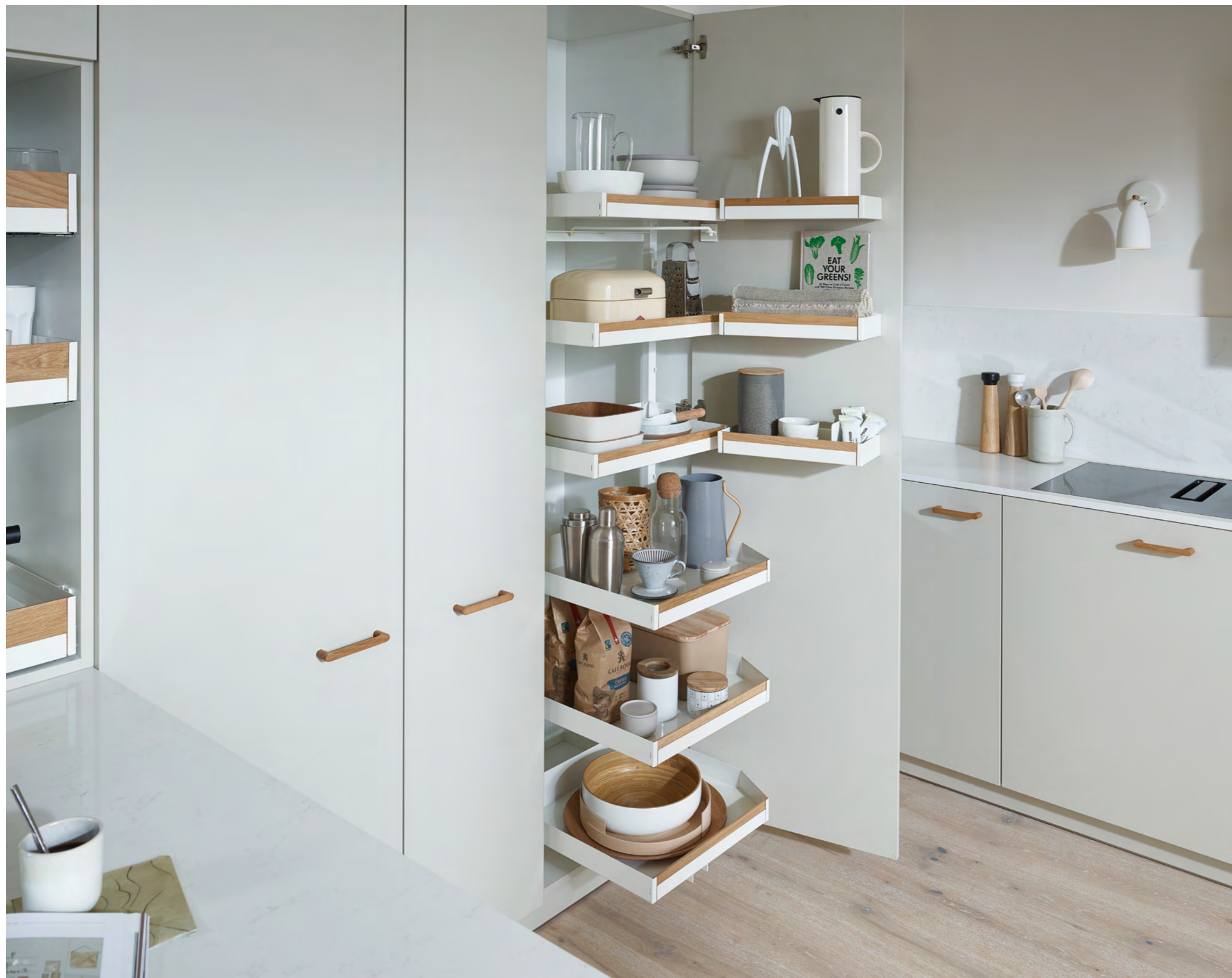
Hochschrankauszug Pleno Maxi Pleno Maxi larder pull-out