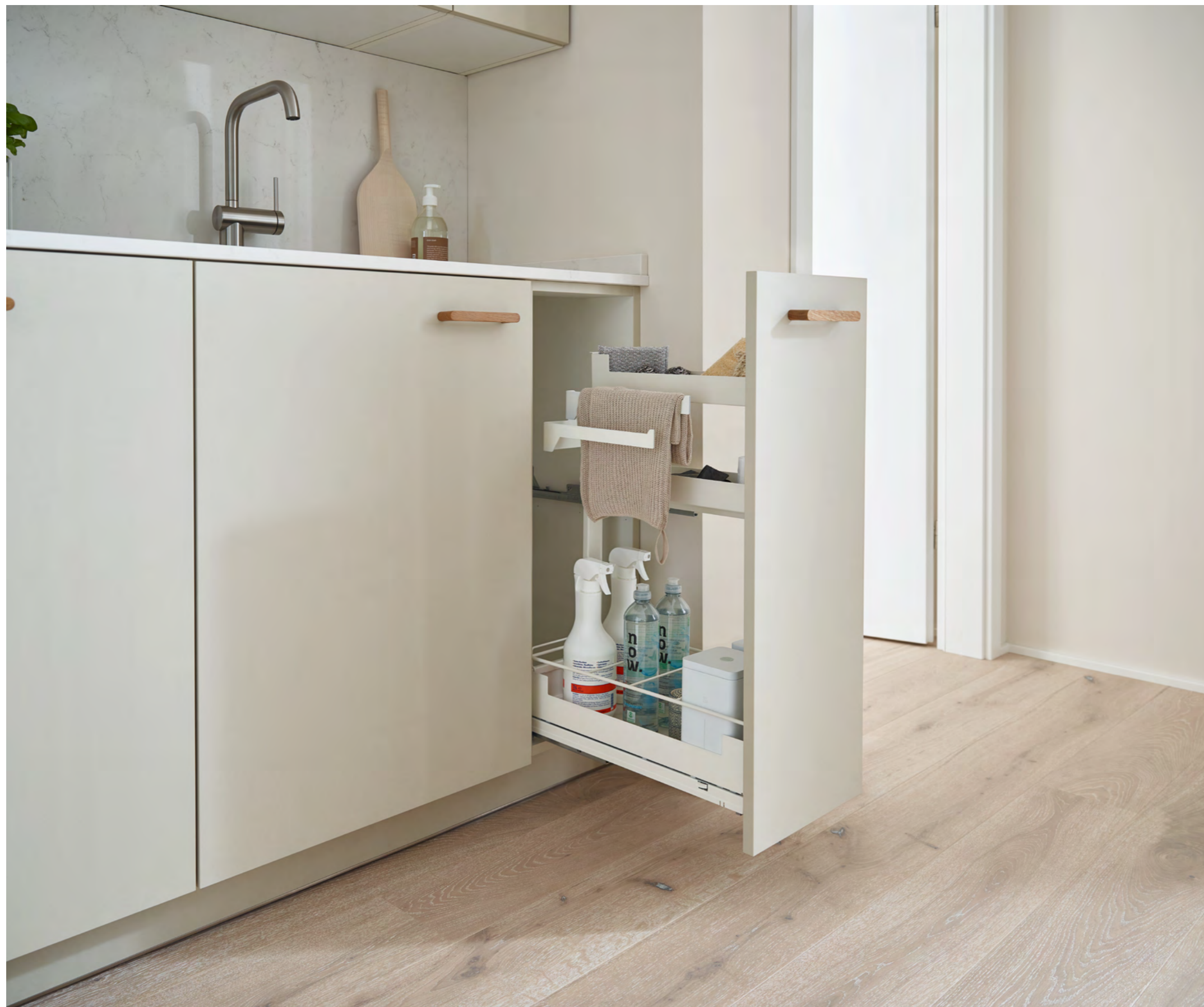
Unterschrankauszug Pinello Towel Pinello Towel base unit pull-out