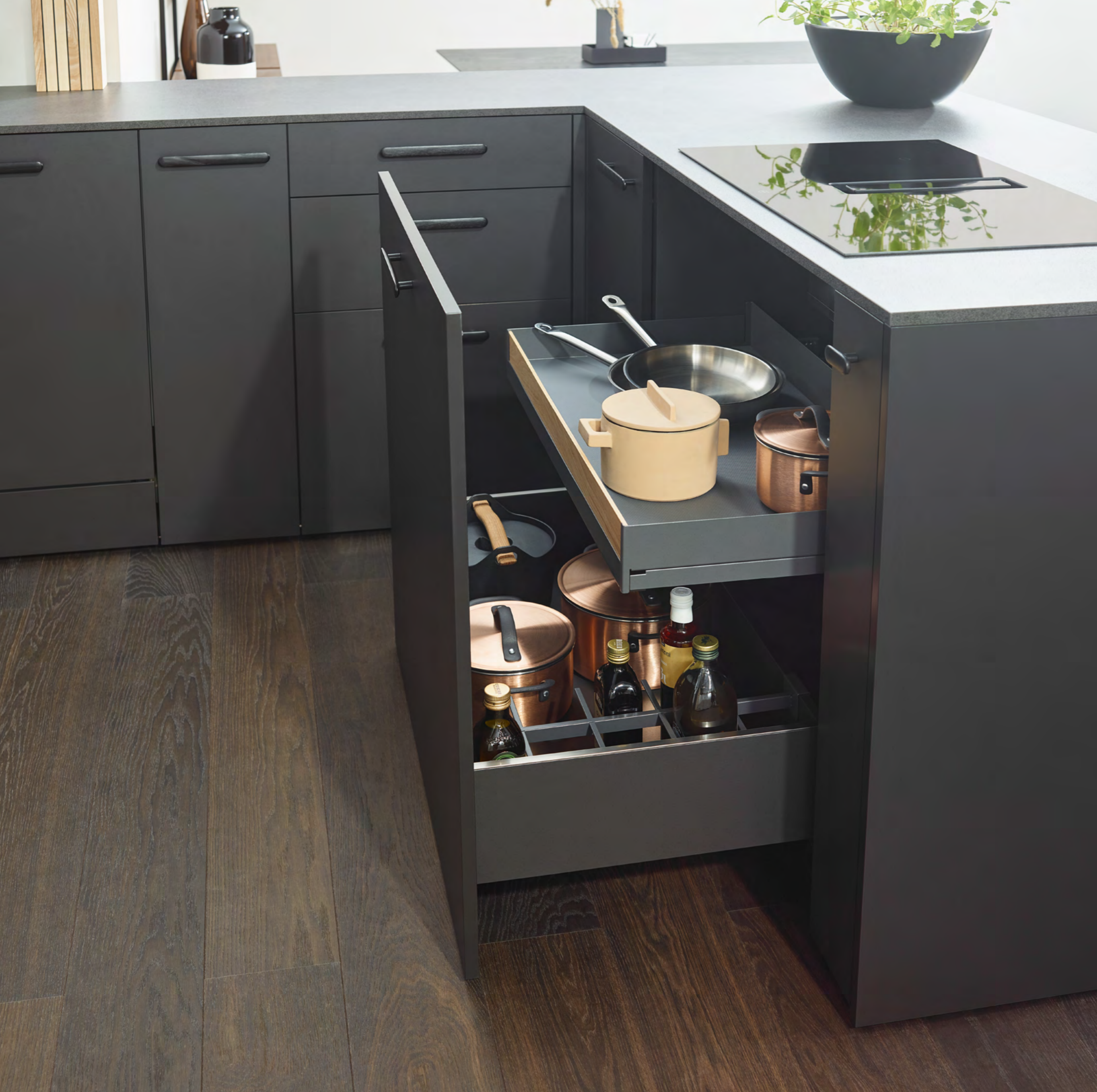
Auszugstabil Extendo als Innenauszug Extendo pull-out shelf as an internal pull-out