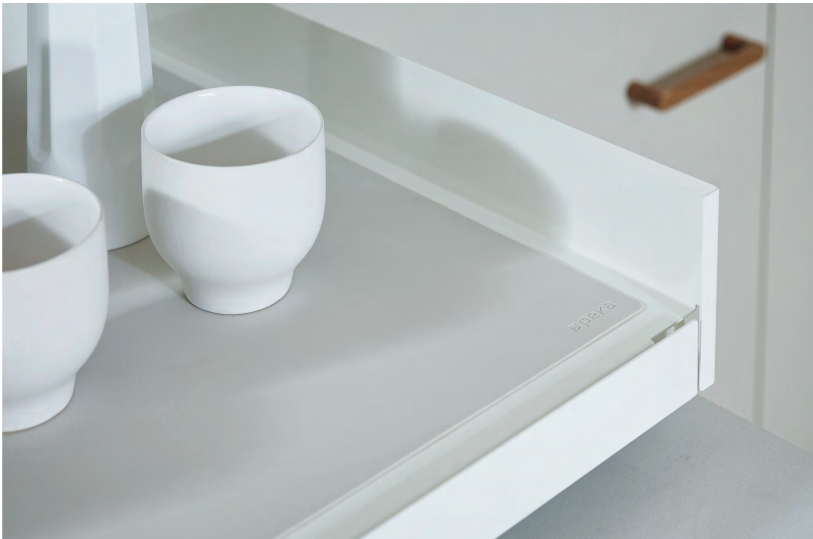
Auszugstabil Extendo Extendo pull-out shelf