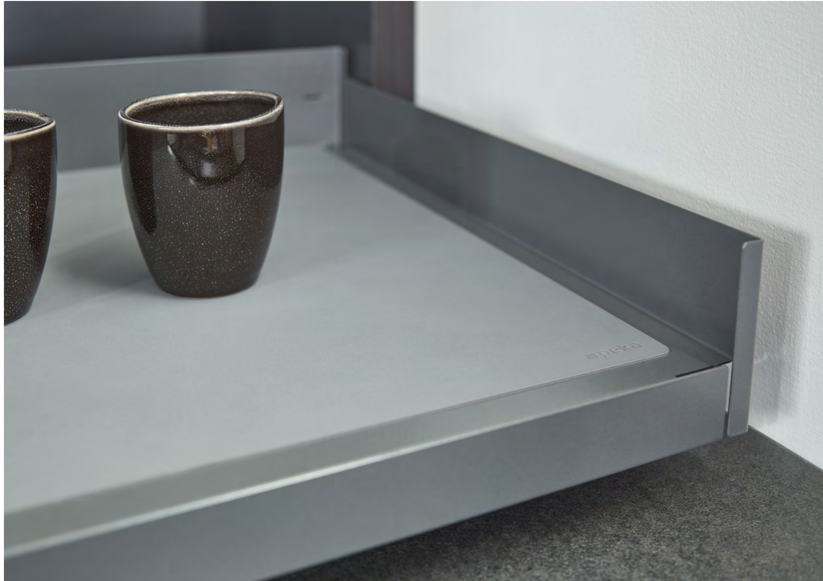
Auszugstabl原因 Extendo mit Antirutschmatte aus Silikon Extendo pull-out shelf with non-slip mat made from silicone