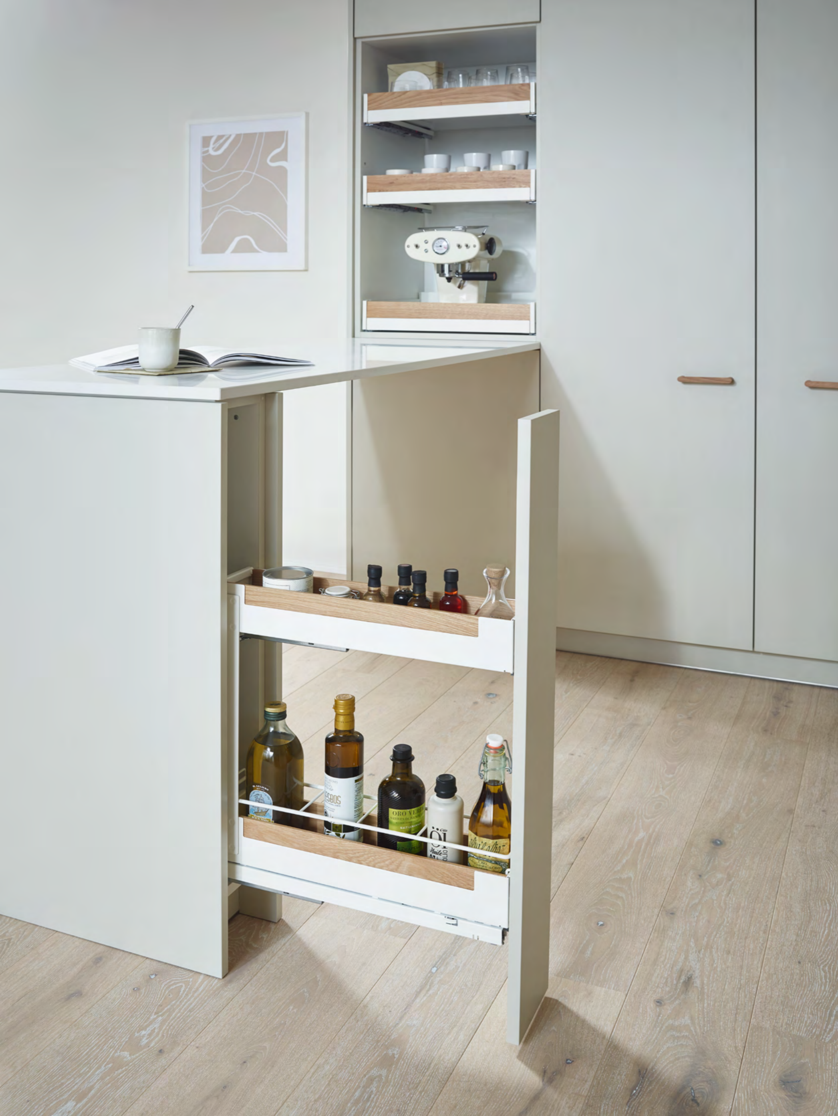
Unterschrankauszug Pinello Spice Pinello Spice base unit pull-out