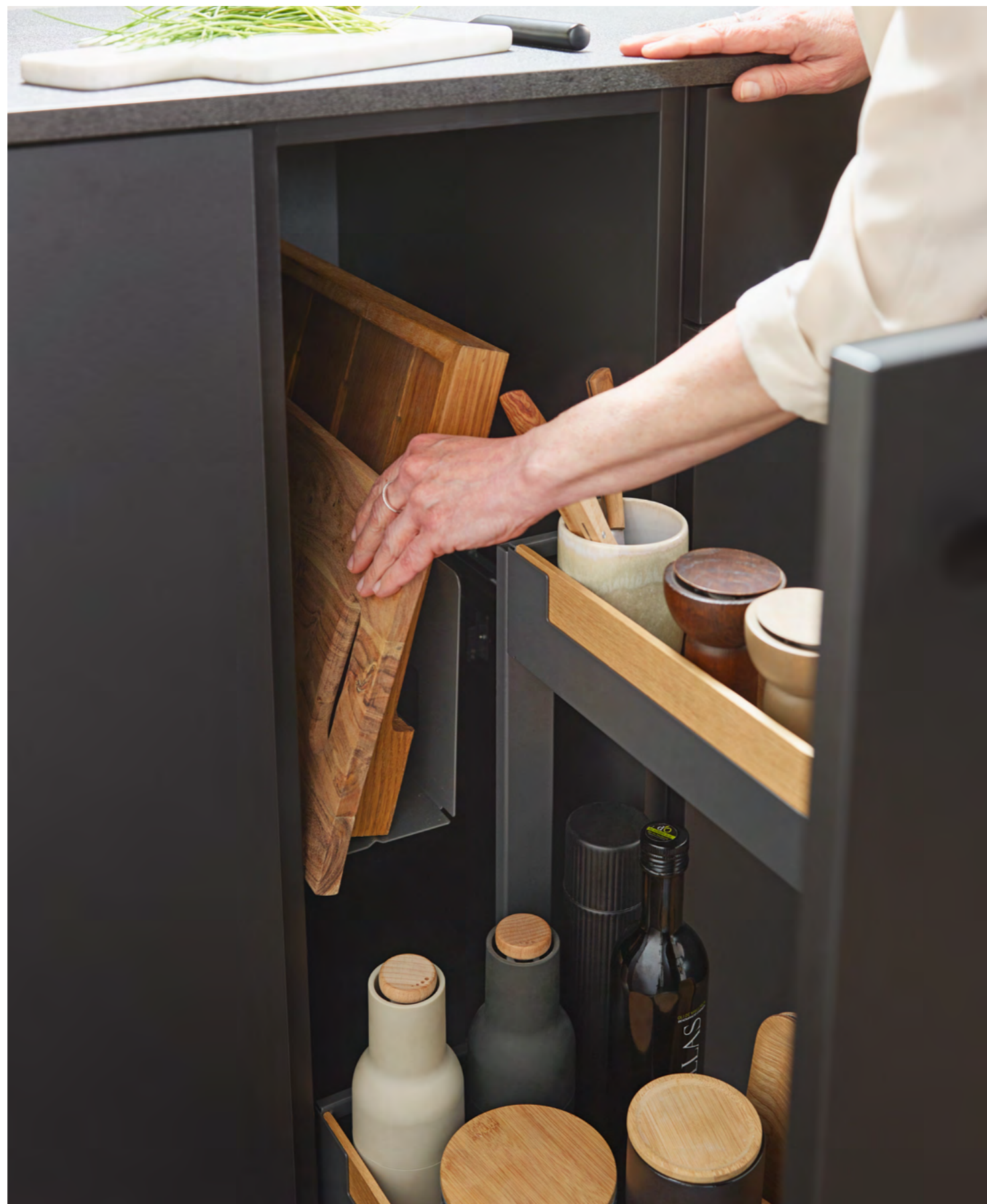
Unterschrankauszug Pinello Board Pinello Board base unit pull-out