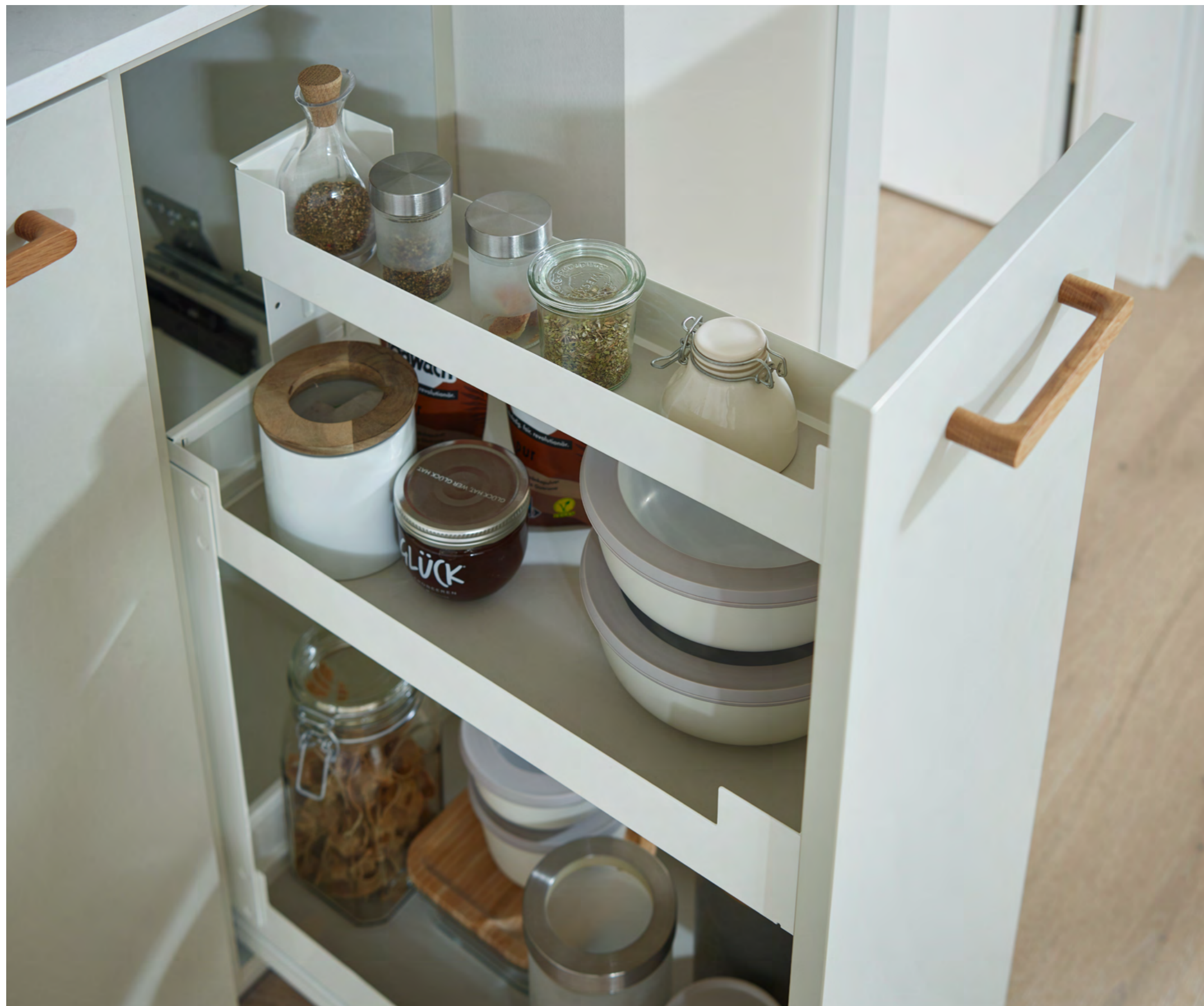
Unterschrankauszug Pinello Cargo Pinello Cargo base unit pull-out