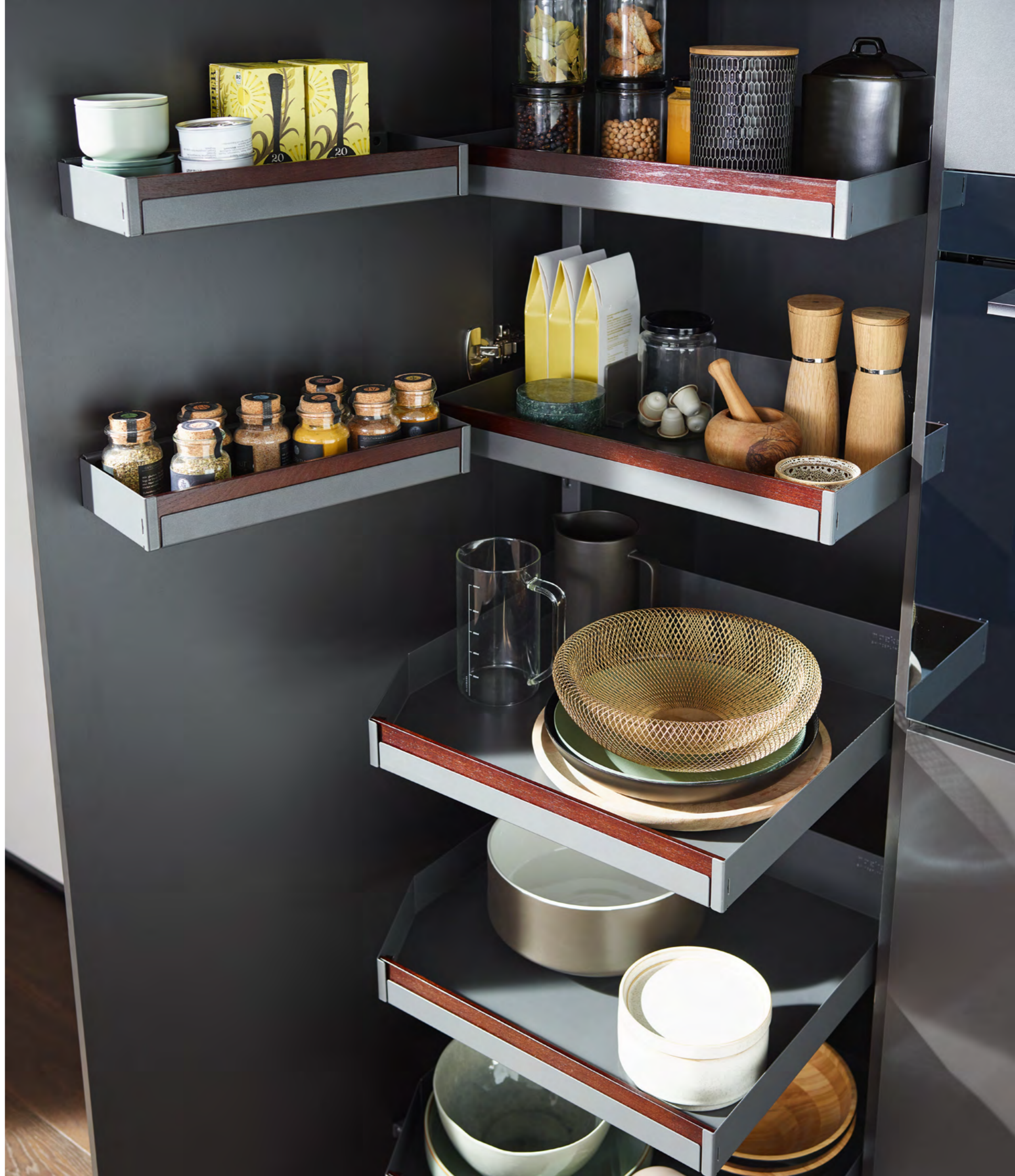
Hochschrankauszug Pleno Maxi Pleno Maxi larder pull-out