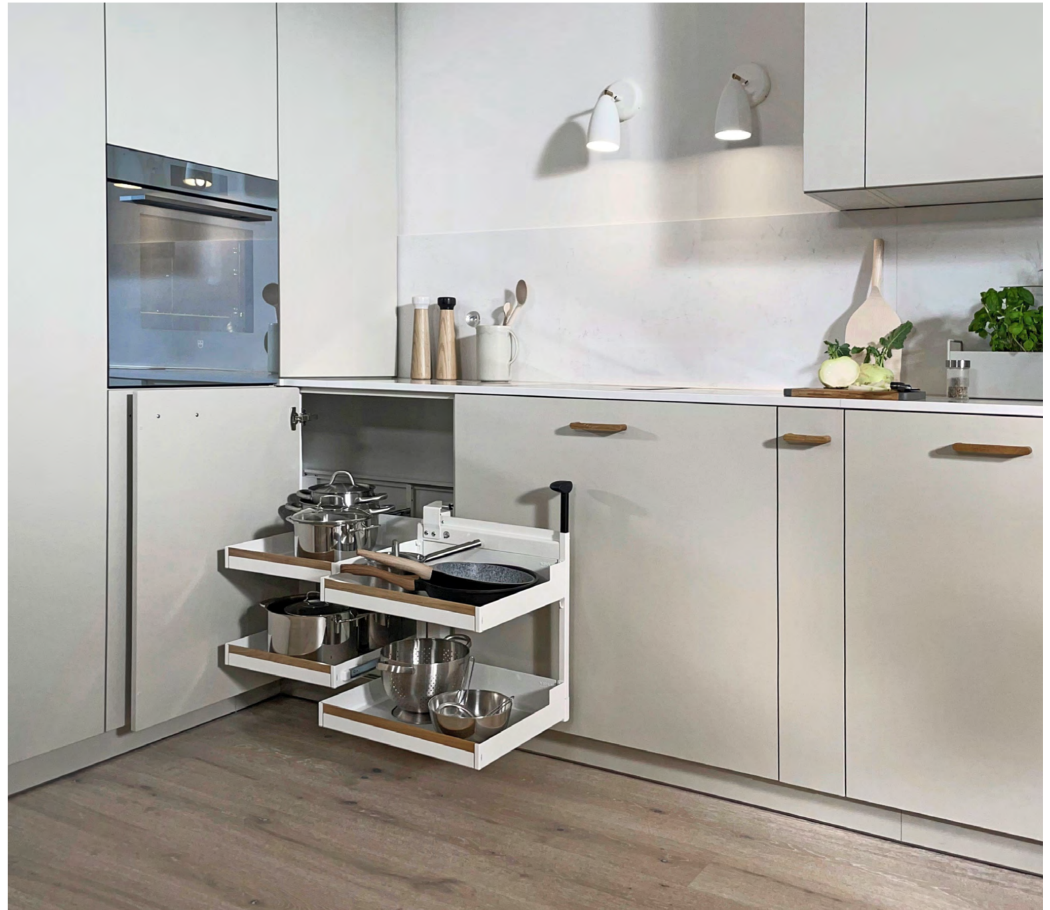
Eckauszug Magic Corner Comfort Magic Corner Comfort corner pull-out