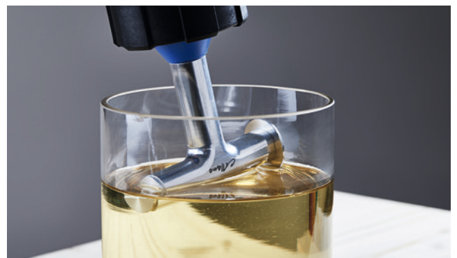
Immergé dans Collano HP 4000, il empêche la colle de durcir à l'intérieur et à l'extérieur de la buse.