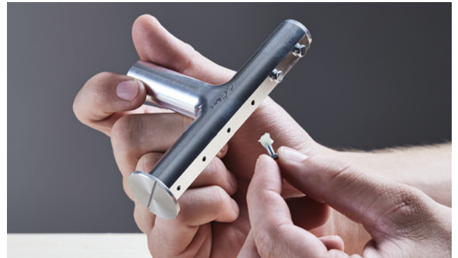
Nombre individuel de cordons de colle en fermant les trous avec des vis.