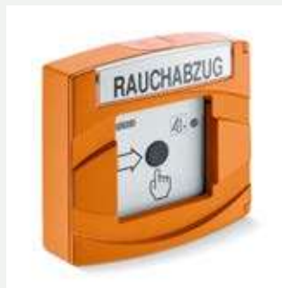
FT 4 A Nebenbedienstelle (198914)