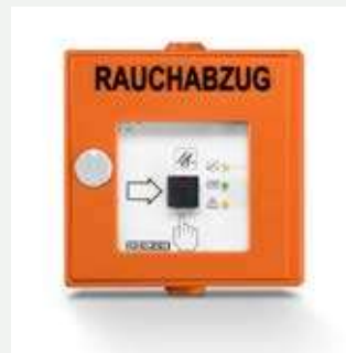
RWA-Taster FT 4 K (136232)