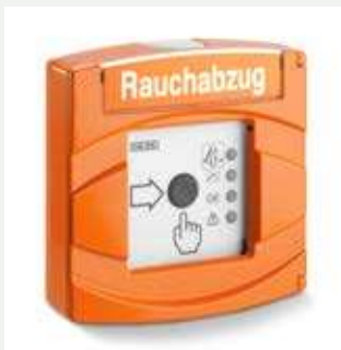
RWA-Taster FT 4 A Akustisch (198925)