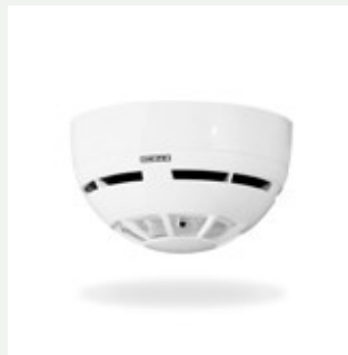
Rauchmelder GC 162 RWA (184110)