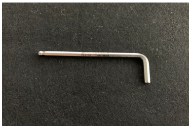
Clé allen SW 4