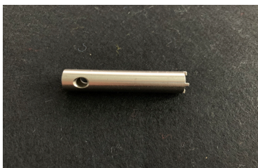
Outil de réglage BRINER