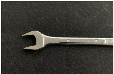
Clé à fourche SW 18