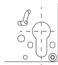
Detail: Variante PZ-Lochung