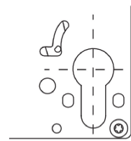
Detail: Variante PZ-Lochung

Nähere Funktionsbeschreibung siehe Seite 43