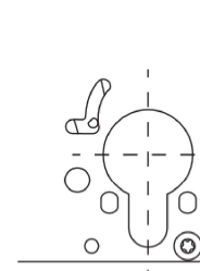
Detail: Variante CHRZ-Lochung