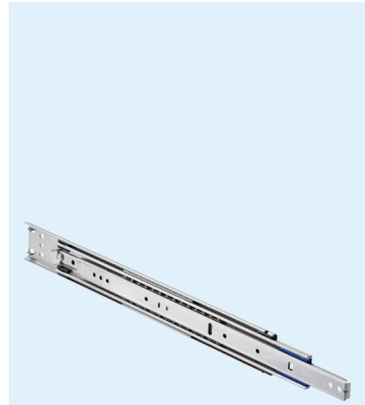
Stainless steel Acier inoxydable Edelstahl